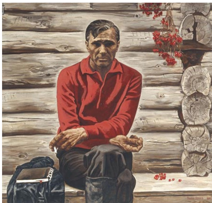
В. М. Шукшин. Портрет работы Виктора Писарева. 1988 г.