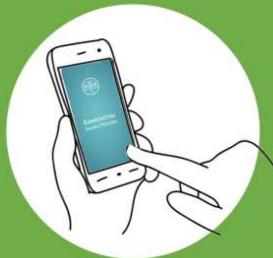
Мобильное приложение «Банкноты Банка России»