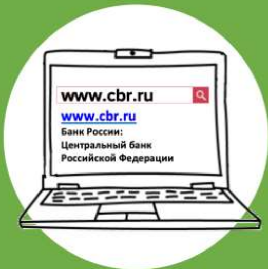
На сайте Банка России