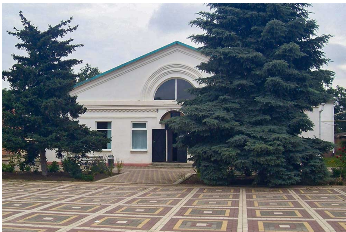
Межпоселенческая центральная библиотека

На 2024 год уже три библиотеки района модернизированы по модельному стандарту.