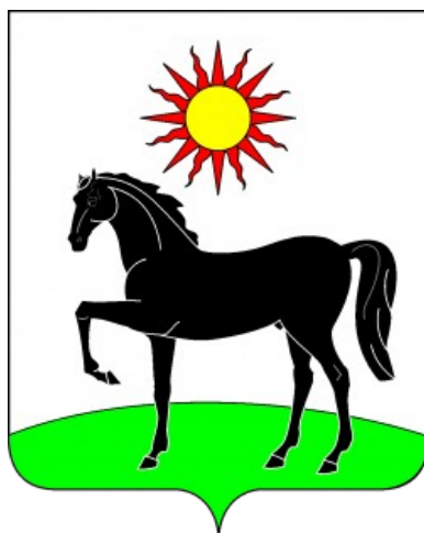
Герб Целинского района

Геральдическое описание герба Целинского района гласит: