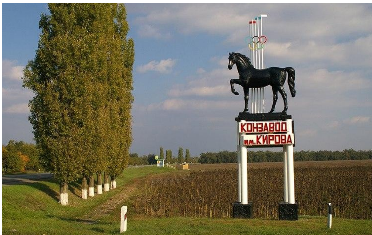
Конезавод имени Кирова

Сальские степи с их огромными площадями целинных и залежных земель издавна привлекали состоятельных предприимчивых людей. Их манило в эти края обилие весенне-летнего разнотравья, повсеместное наличие балок, лиманов, в которых в сухое жаркое время года сохранялись талые и дождевые воды. Эти степи таили в себе прекрасные условия для скотоводства. И потянулись сюда имущие, с наёмными работниками, люди. Занимали большие степные массивы, основывали свои поместья, стали разводить крупный рогатый скот, лошадей. Свободные земли нашего района занимали помещики: Пишваловы, Дроновы, Корольковы, Лосевы, Султан-Гирей, князя Трубецкие. Со временем отдельные поместья стали переходить на выращивание, главным образом, лошадей, это было вызвано тем, что рынок всё больше требовал не только рабочих лошадей для гужевого транспорта, но и ездовых — для армии, для личного пользования небедных людей.