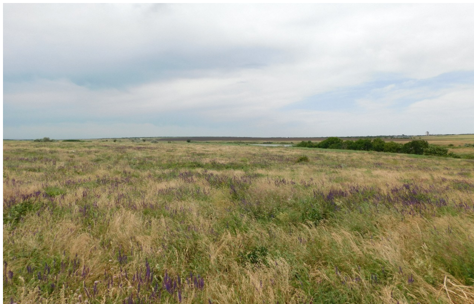
Шалфей. Балка Средняя Юла

примешиваются дербенник иволистный, герань холмовая, клевер ползучий, подорожник большой и пр.