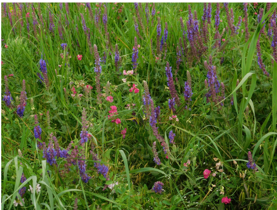
Балка Средняя Юла в июне

Природоохранный статус территория получила 5 января 1980 года согласно Решению Целинского РИК № 6. Балка Средняя Юла представлена характерным для Ейско-Егорлыкской равнины долинно-балочным рельефом левобережной системы долины Маныча с протяженными разветвленными пологими балками и долинами малых рек. Балка ценна как эталонный участок южноприазовского подтипа разнотравно-типчаково-ковыльных степей на восточной границе распространения, важного для изучения процессов ценогенеза степной растительности региона. Является одним из ключевых участков в исследовании фитоценогенеза (изменение растительности в геологических масштабах времени, так называемые «вековые», и в разные геологические эпохи.) Почвенный покров представлен черноземами обыкновенными, среднемощными суглинистыми, смытыми по склонам, дерново-намытыми по днищу. Склоны балки заняты разнотравнополынно-злаковыми степями с преобладанием типчака валлисского (или овсяницы валлисской), полыни австрийской, зопника колючего, молочая Сегье, местами кермека широколистного и тысячелистника тонколистного. В разнотравно-злаковых ассоциациях преобладают овсяница валлисская, василистник малый, перловник трансильванский, пырей ползучий, шалфей остепнённый. Около трети склонов