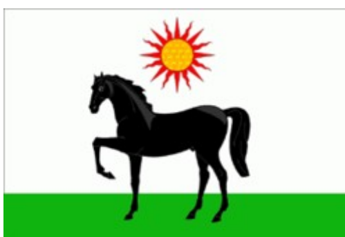
Флаг Целинского района