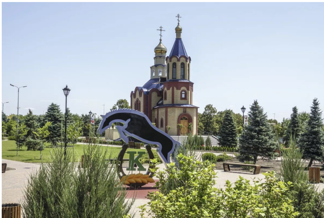
Храм св. Флора и Лавра п. Вороново

Сегодня конезавод им. Кирова - одно из ведущих предприятий Ростовской области и России по производству зерновых, включающее в себя продуктивное молочное животноводство и племенное коннозаводство. Находится он на территории п. Вороново Кировского сельского поселения.