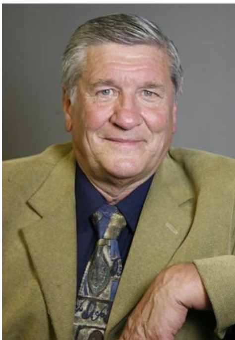
Виктор Вихров, народный артист.

Лапенков, А. 85 лет Ростовской области. Целинский район [Электронный ресурс] // Таганрогская правда. - 2022. - URL: https://taganrogprav.ru/85-let-rostovskoj-oblasti-celinskij-rajon/?ysclid=lzgv5b7yag30932991 (Дата обращения 05.08.2024)