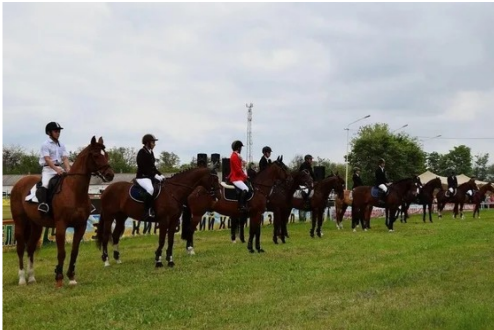
Всероссийские соревнования в Конезаводе имени Кирова

В наши дни гордостью района является Кировский конный завод, чьи лошади считаются одними из самых лучших нашей стране. Сейчас в районе сосредоточено наибольшее в Европе поголовье элитных тракененских лошадей. Неоднократно они занимали призовые места на международных соревнованиях и мировых первенствах. Здесь был выращен легендарный жеребец Пепел,