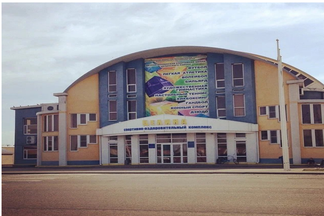
Спортивный комплекс п. Целина

По самым современным требованиям эстетики благоустраивается посёлок и район, успешно выполняется программа «Устойчивое развитие сельских территорий», ежегодно совершенствуются и вводятся в строй всё новые объекты культуры, дошкольного воспитания, дорожного строительства, зоны отдыха, детские площадки.