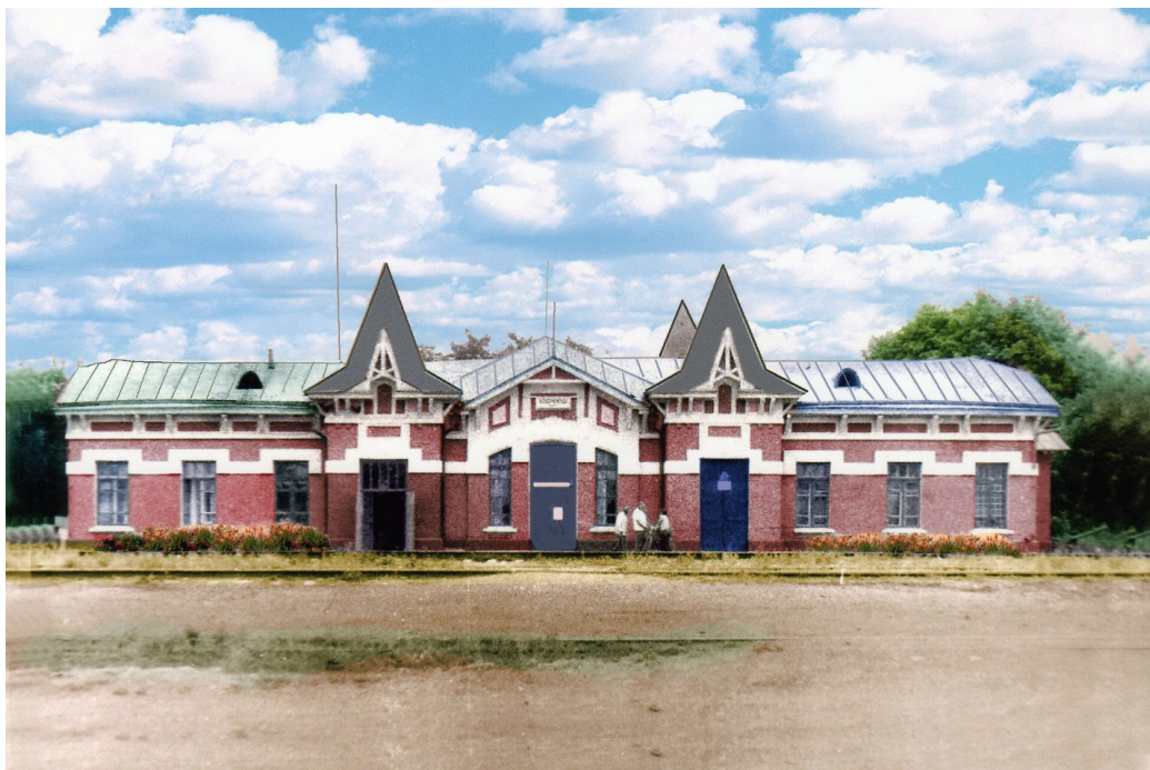
Станция Целина, первоначальный вид. Была разрушена немцами в 1943 году