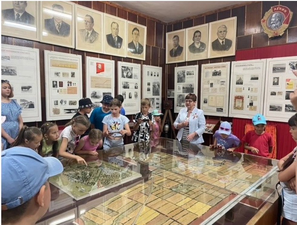
Музей истории Целинского района

В настоящее время музей истории Целинского района продолжает свою работу, проводя краеведческие и патриотические мероприятия и выставки.