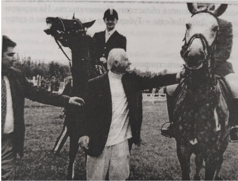
Тур Хейердал во время визита на конезавод им. Кирова