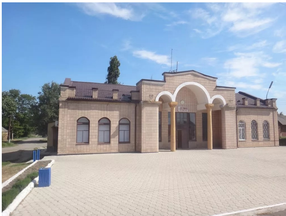
Станция Целина. Современный вид

Посёлок Целина ведёт свою историю от станции Целина, которая начала действовать 1 марта 1916 года, с открытием движения на донской линии Батайск — Торговая Владикавказской железной дороги. 1 марта 1916 года по этому