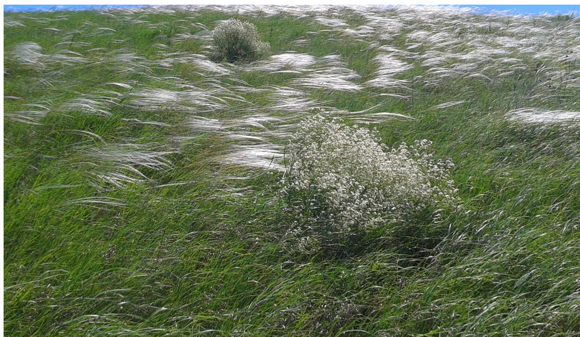
Цветение ковыля в балке Средняя Юла

Балка Средняя Юла - ботанический природный парк местного значения с режимом заказника. Это редкий в области участок естественной типчаково-ковыльной степи. Расположена она в юго-восточной части района на границе с Сальским районом, в четырёх километрах к югу от с. Юловского (Сальского района). Балка Средняя Юла включает в себя три отдельных балки, вытянутые с севера на северо-запад. У них имеется общее русло, все три балки постепенно впадают в пруд.