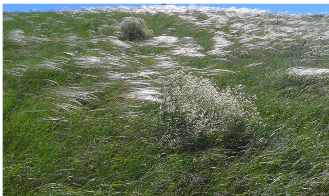
2 километра в юго-восточном направлении от хутора Зеленая Балка в Целинском районе Ростовской области.