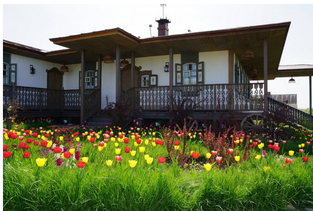
Ростовская область, Константиновский район, х. Старозолотовский, ул. Есаульская Контактный телефон: 8(961)321-28-45.